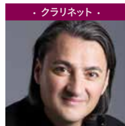
・クラリネット・ フローラン・エオー Florent Héau パリ地方音楽院教授