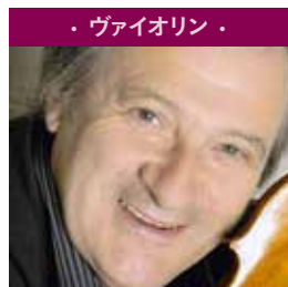
・ヴァイオリン・ レジス・パスキエ Régis Pasquier パリ・エコール・ノルマル音楽院教授